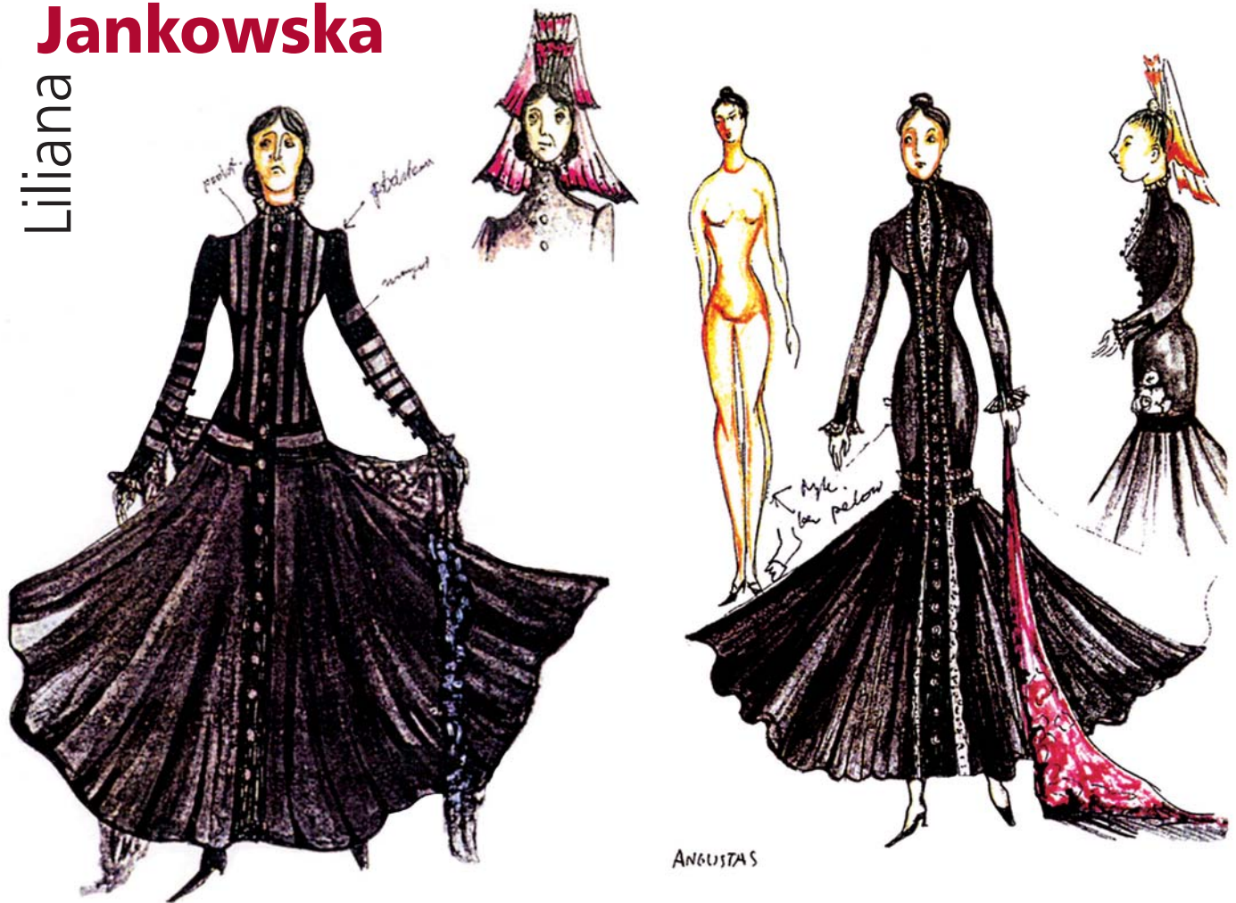
„Sarkofag diabła” J. A. Dobrzański, reż. L. Komarnicki