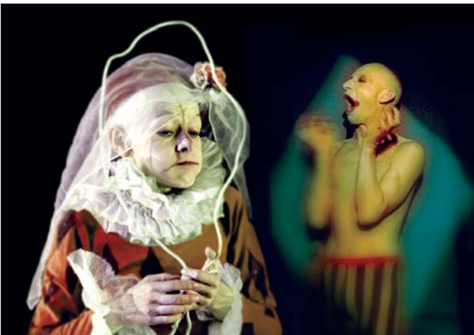
Teatr Derevo (Rosja) – „The Fight Of The Harlekin With His Own Shadow In Search Of The Barrel of Wine And The Eternal Life”

Do słabszych momentów Spoiw Kultury zaliczyć trzeba, niestety, występ słynnego rosyjskiego Teatru Derevo. Choć niezwykle efektowny od strony wizualnej spektakl „The Fight Of The Harlekin With His Own Shadow In Search Of The Barrel Of Wine And The Eternal Life” najwyraźniej w świecie mężczyźni i nużył. Publiczność negatywnie zaskoczył też absolutny zakaz robienia zdjęć (pod groźbą zerwania spektaklu), wydany przez aktorów Dereva. Większych zachwytów nie wywołała też „Charanga” portugalskiego teatru Cricolando, usypiająca opowieść o pogoni za marzeniami. Zgodnie chwalono jedynie oprawę muzyczną widowiska.