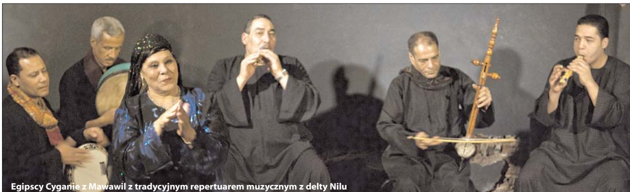
Egipscy Cyganie z Mawawil z tradycyjnym repertuarem muzycznym z delty Nilu

Kurier Szczeciński nr 12906-07-2010