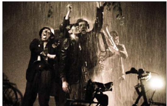
Teatr Cricolando (Portugalia) - „Charanga”