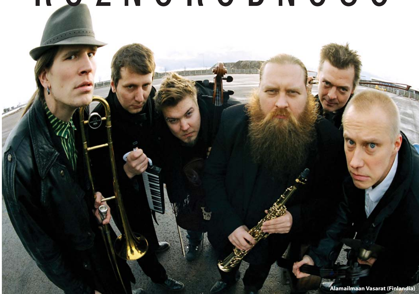
Alamailmaan Vasarat (Finlandia)

B były punkty bardzo jasne, były i spore zawody, ale jako całość tegoroczne Spoiva Kultury stanowiły propozycję bardzo stylistycznie różnorodną i atrakcyjną. Festiwal trwał cztery dni i zakończył się w nocy z soboty na niedzielę.