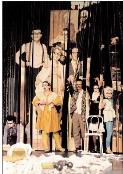
Teatr Licedei (Rosja) – „Semianuki”

Zupełnie innego skupienia wymagało „Salto Mortale” poznańskiego Teatru Strefa Ciszy. Szczecińska historia o fortepianach, zrabowanych przez radzieckich żołnierzy niemieckim mieszkańcom miasta i porzuconych następnie przy torach kolejowych w porcie, czarowała klimatem. Wystawiony na Łasztowni spektakl, bardzo widowiskowy, z ciekawymi elementami choreograficznymi, to tak naprawdę opowieść o przewrotności losu, o odrzucaniu starego ładu i budowaniu na jego gruzach nowego, zupełnie innego, pozbawionego ciężaru pamięci.