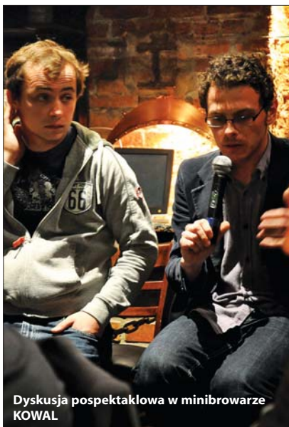
Dyskusja pospektaklowa w minibrowarze KOWAL